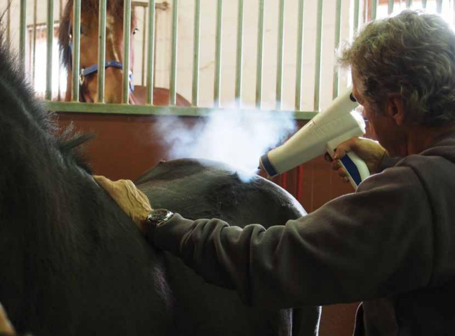
Huippukylmäkäsitelyssä nestemäinen hiilidioksidisuihku aiheuttaa hoidettavaan kohtaan termoshokin.

enemmän rasitusta hevosen välttellessä paineen tunnetta lonkassaan. Tällaiselle hevoselle varsinkin kaarrejuoksu on hyvin vaikeaa ja usein se haluaa kilpailuvauhdissa hidastaa 1500 metrin jälkeen. Sisukas hevonen voi vielä juosta maaliin asti, mutta uskon että moni "toppari" kärsii tästä vaivasta. Molempien puolten limapussien tulehdustila näkyy hevosen liikkeessä vaihtelevana epätasaisuutena, kun hevonen säättää liikettään kulloisenkin kiputilan mukaan, Aimo kertoo.