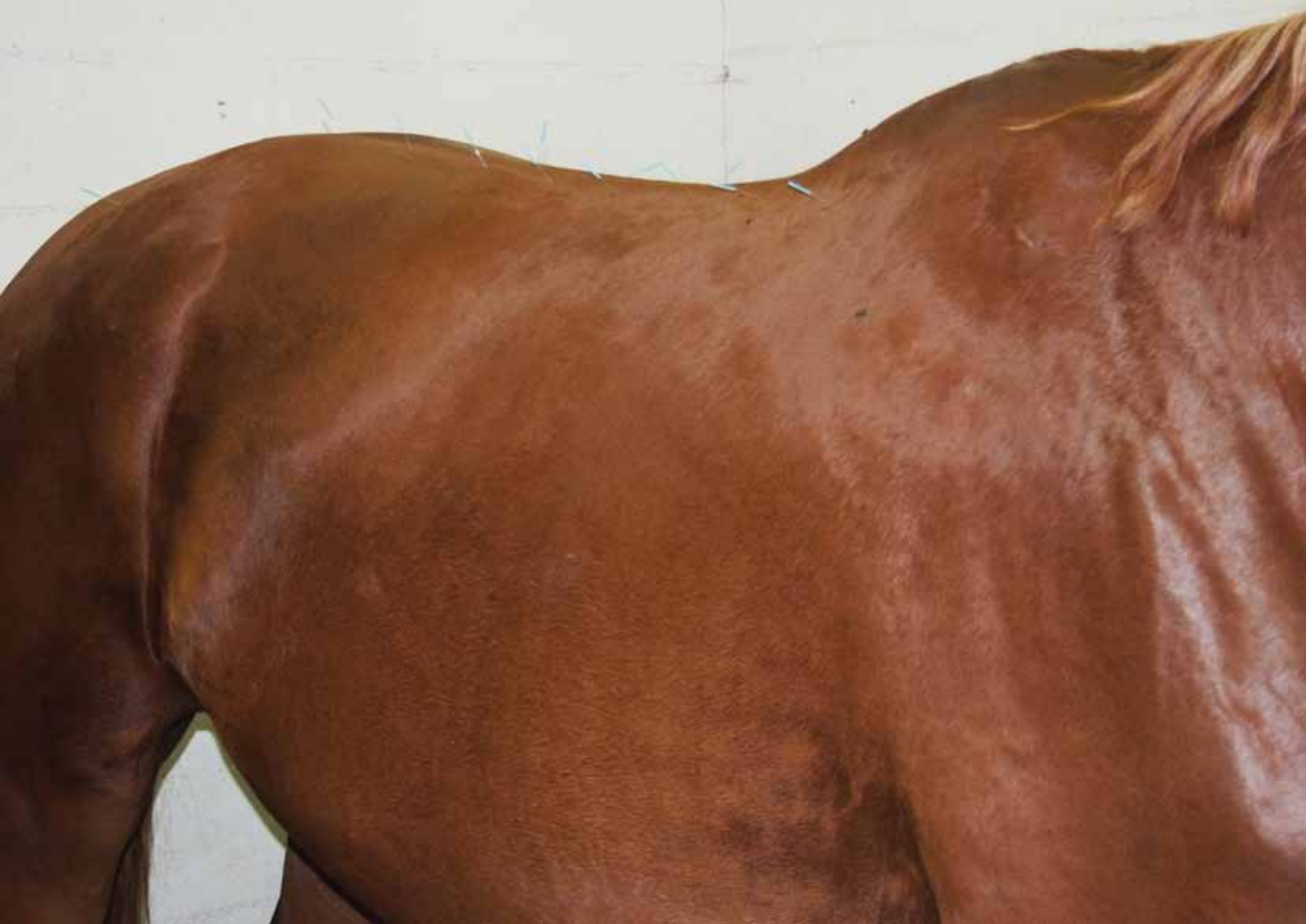
Akupunktioneula ärsyttää hermopistettä sen verran, että kiputila saadaan laukeamaan.